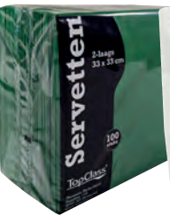
Donkergroen Art.nr. 69917