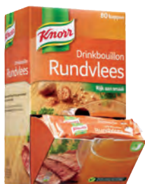
Tuinkruiden Art.nr. 33170