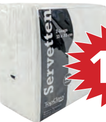
Wit Art.nr. 69910