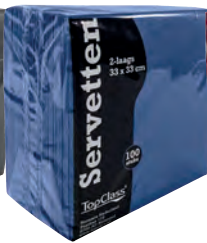
Donkerblauw Art.nr. 69918