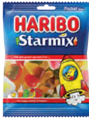
Starmix 75 gr Art.nr. 40499