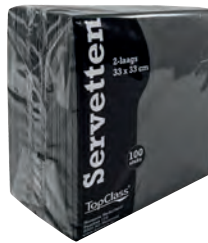
Zwart Art.nr. 69940