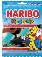
Kindermix 75 gr Art.nr. 40496