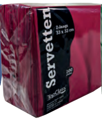
Bordeaux Art.nr. 69915