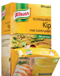
Kip met Tuinkruiden Art.nr. 33167