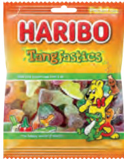
Tangfastics 75 gr Art.nr. 40494

Snoepzakjes doos 28 x 70/75 gr 15.95 p/doos