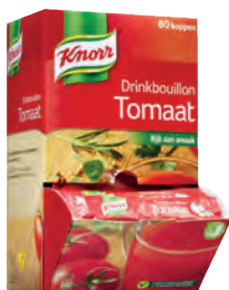
Tomaat Art.nr. 33169