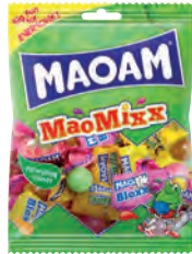
MaoMixx 70 gr Art.nr. 40493